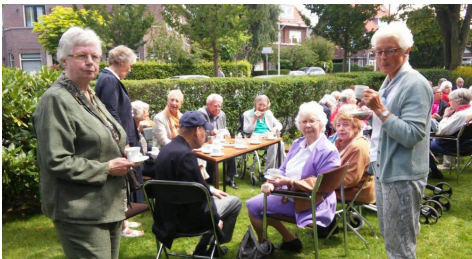
Koffie en gebak in H. Driekoningen

In H. Jacobus had de St. Jacobsstaf de ouderen de gelegenheid geboden naar het Rozenkransgebed en de middagmis te komen. De mensen die niet zelf konden komen, werden thuis opgehaald.