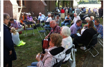
Lunch in Brielle

Bij de veerboot van Maassluis werden groepen uit andere parochies en de busvaarders getroffen. Met als thema ‘Wees Barmhartig’ was er een pontificale Eucharistieviering en werd de Heilige Deur geopend. In de middag was er rozenkransgebed en de kruisweg door de rondgang. De dag werd afgesloten met een vesperviering en processie. Na het ontvangen van de pelgrimszegen keerden de parochianen per fiets weer huiswaarts.