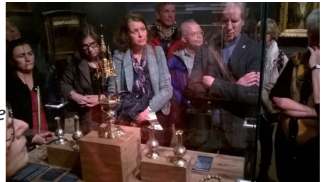
Rondleiding in Haags Historisch Museum

Ter gelegenheid van de herdenking van 450 jaar overgang Grote of Sint Jakobskerk hebben op 30 oktober ongeveer zestig mensen van verschillende kerkelijke achtergrond deelgenomen aan de wandeling door Den Haag van de katholieke Jacobuskerk naar de Grote Kerk via het Haags Historisch museum en de Oud katholieke schuilkerk. Ter afsluiting vond aldaar een gebedsviering plaats.