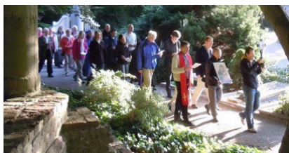
In processie bij Oud Eik en Duinen

Met Hemelvaart zijn 's ochtends vroeg uit alle geloofsgemeenschappen mensen gaan 'dauwtrappen' en wandelend op bedevaart gegaan naar Maria van Oud Eik en Duinen alwaar een gezamenlijke Eucharistieviering met parochie De Vier Evangelisten werd opgedragen.