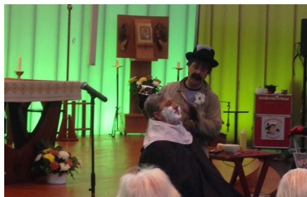
Dorus met grappen en grollen

Met een plechtig lof en uitstelling van het H. Sacrament wordt de dag afgesloten met een mooi Ave Maria gezongen door moeder en schoondochter.