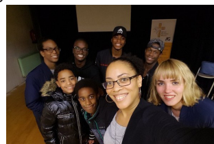
M25 by night