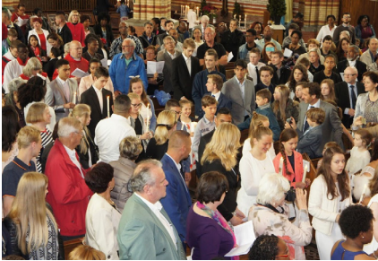
Processie met vormelingen

Zondag 22 mei ontvingen 40 vormelingen het sacrament van het H. Vormsel in de H. Marthakerk. De mis was indrukwekkend, met name bij binnenkomst: de kinderen kwamen met kaarsen in processie binnen. Het moment van de zalving temidden van de ouders was spannend voor kind en ouder. De twee koren, Heaven's Touch en PaMa, met elk een eigen geluid, zorgden voor de muzikale kers op de taart.