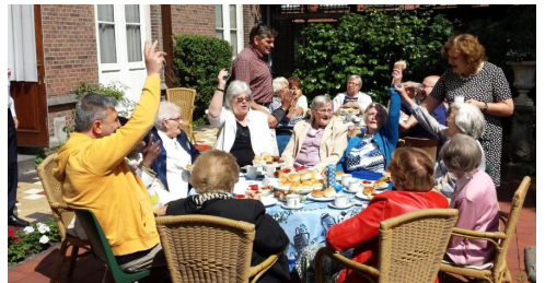
High tea in H. Jacobus