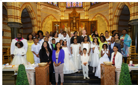
Communieviering in H. Willibrord