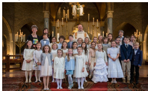
Communieviering in H. Driekoningen