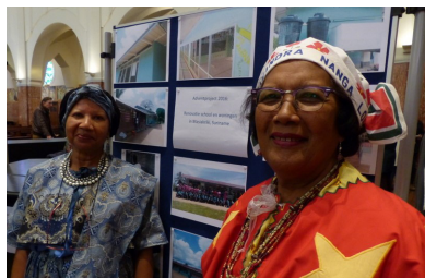
Dames van Surinaamse gemeenschap promoten adventsactie.

In 2016 hebben de gezamenlijke werkgroepen 'Missie, Ontwikkeling en Vrede' (MOV) voor het eerst één gezamenlijk adventproject gekozen. Doel van de actie was geld bij elkaar te brengen voor de renovatie van een basisschool en vijf onderwijzerswoningen in Masiakriki, in het binnenland van Suriname. Er is € 10.500 binnengekomen.