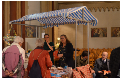
Alle ruimte voor ontmoeting en gesprek

Op 7 oktober 2017 is voor het eerst een gezamenlijke parochiedag georganiseerd. Tijdens deze parochiedag presenteren alle geloofsgemeenschappen zichzelf: wat is onze "kleur", wat maakt ons 'ons'? Tevens worden activiteiten georganiseerd waarin men elkaar op een andere manier leert kennen.