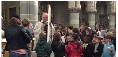
De kinderen rond de paaskaars

Ouders, kinderen en iedereen die wilde was welkom bij deze speciale paaswake. Uit bijna alle geloofsgemeenschappen waren families aanwezig. Het was een mooie viering en een geslaagd initiatief!