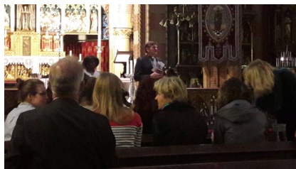
In gesprek over kindermishandeling

Tijdens deze bijeenkomst vertelde een ervaringsdeskundige wat veiligheid en onveiligheid voor haar als kind betekende. De aanwezigen reageerden met verdriet en verbijstering op het dappere verhaal van de ervaringsdeskundige. Er waren 50 tot 60 personen aanwezig. Na afloop vonden zeer goede gesprekken plaats.