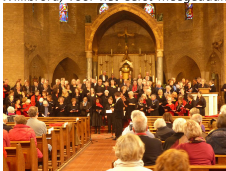
Spetterende afsluiting door alle koren

Heaven's Touch heeft, als koor van de H. Willibrord, voor het eerst meegedaan aan het Ceciliaconcert van de parochie. Als enige koor met muzikale begeleiding door een bandje en een volledig andere stijl en repertoire dan de meeste koren die meededen, was het ontzettend spannend maar ook geweldig om hier aan mee te mogen doen. En we waren blij en zeker trots met alle positieve reacties die we hebben ontvangen. Heaven's Touch gaf met een Caribisch tintje een geweldige presentatie.