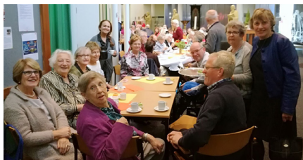
Lunch uit het vuistje

Uit alle hoeken van Den Haag waren de ouderen gekomen om deze dag mee te maken. De dag werd geopend met een plechtige Hoogmis. Hierna werd er in een ontspannen sfeer koffie of thee geserveerd en kreeg ieder ook nog brood uit het vuistje.