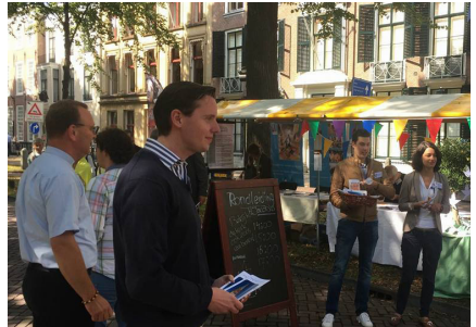
Zichtbaar aanwezig in de stad

Op zondag 3 september heeft de parochie meegedaan aan de cultuurmarkt van het Haags UIT festival. Mensen konden een wens of gebed ophangen in de vredesboom, of een kaarsje meenemen en opsteken in de H. Jacobuskerk, waar tevens rondleidingen werden gegeven. De kinderen kregen de kans om zelf een kaars te versieren en met extra veel betekenis op te steken. De aanwezige vrijwilligers en leden van het pastoraal team zijn met vele bezoekers in gesprek gekomen. En uiteindelijk hebben meer dan 300 mensen een bezoek gebracht aan de kerk en een kaarsje opgestoken.