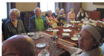
High Tea in de pastorie

De bedoeling was een tuinfeest maar het regende helaas pijpenstelen. Gelukkig was er genoeg plaats in de grote zaal. Iedereen kon een plek vinden waarna het feest begon. Vele echt Engelse lekkernijen werden geserveerd en er werd gezellig gepraat. Een feestelijke bijeenkomst op dit belangrijkste Mariafeest.