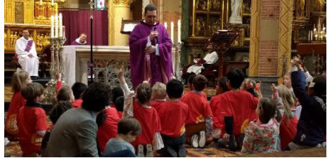
KISI workshop voor de kleinsten

In alle gemeenschappen zijn er gezinsvieringen, ook waren er bijzondere vieringen zoals een viering met de KISI kids, de Franciscusviering met de zegening van huisdieren en het kindje wiegen in zowel de H. Ignatius van Loyola als H. Jacobus de Meerdere.