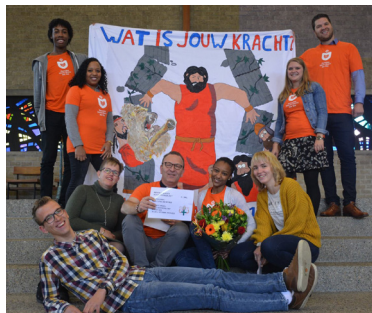
Het team van het Willibrordkamp

Het doel van het kamp is de kinderen een fantastische week te geven en een boost door 3 gezonde maaltijden per dag.