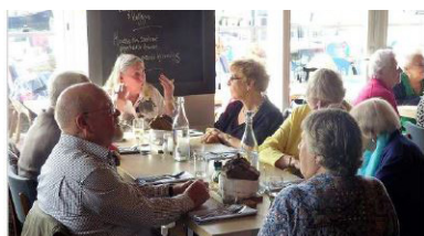
Heerlijk samenzijn in de Dagvisser

Op 16 oktober organiseerde de Lidwina groep van de H. Antonius voor 40 ouderen een lunch in restaurant De Dagvisser. Het was gezellig druk aan het strand, tijdens de maaltijd was er ruim gelegenheid om de laatste nieuwtjes uit te wisselen. Voor alle aanwezigen een geslaagde middag.