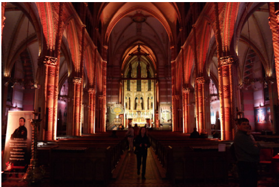
De kerk was prachtig aangelicht

Op 21 oktober deed de H. Jacobus de Meerdere, namens de Haagse Gemeenschap van Kerken en onze parochie, mee aan de jaarlijkse Museumnacht. De kerk is geen museum, maar een religieus gebouw. Daarom werd gekozen om de belangrijke spirituele elementen uit het gebouw te versterken en op een speciale manier laten zien aan de bezoekers. Een positieve avond, ruim 300 mensen hebben de keus gemaakt om de drempel van de kerk over te gaan en zich te laten raken en inspireren voor het moois dat de kerk hen te bieden heeft.