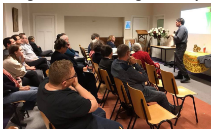
Deelnemers luisteren naar de inleiding

Na de eerste avond was de reactie: 'Een goede, warme sfeer; fijne ontmoeting en vruchtbare deelgroep sessies; het belooft een mooie cursus te worden voor iedereen'.