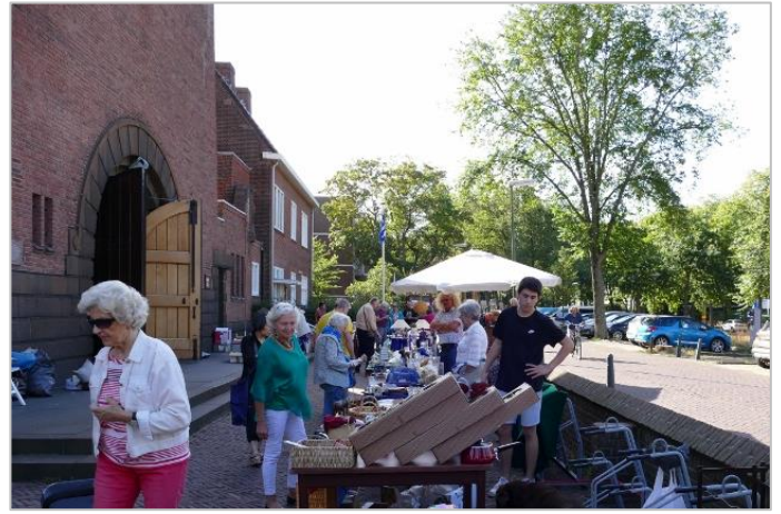
Op de buitenkramen is het aanbod heel divers