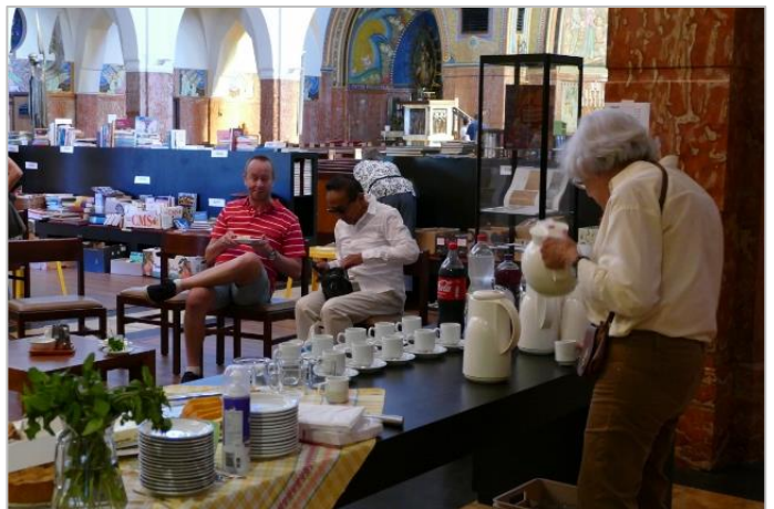
Anders wel voor koffie, taart, broodje