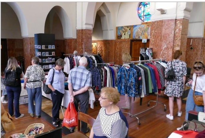
Voor kleding is ook altijd belangstelling