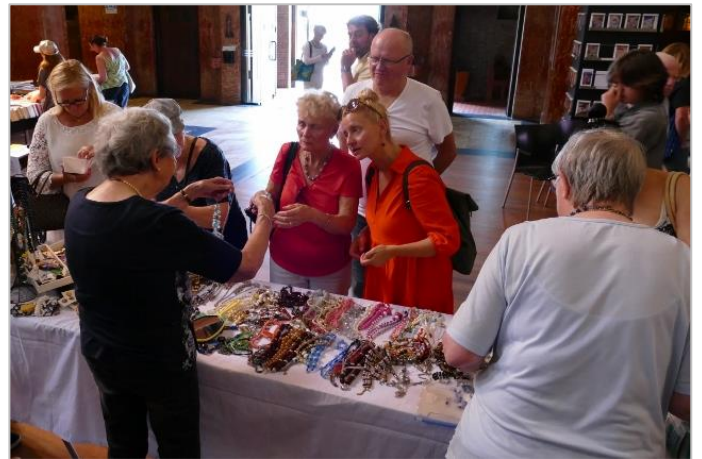
Sieraden trekken altijd kijkers... en kopers