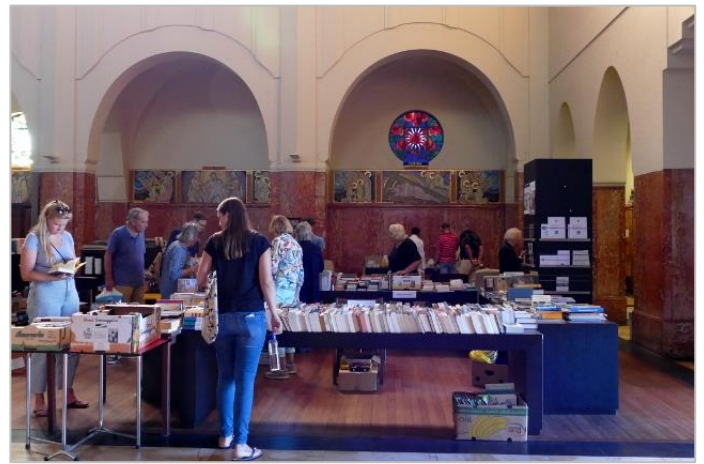
Zaterdag: er zijn altijd boekenliefhebbers