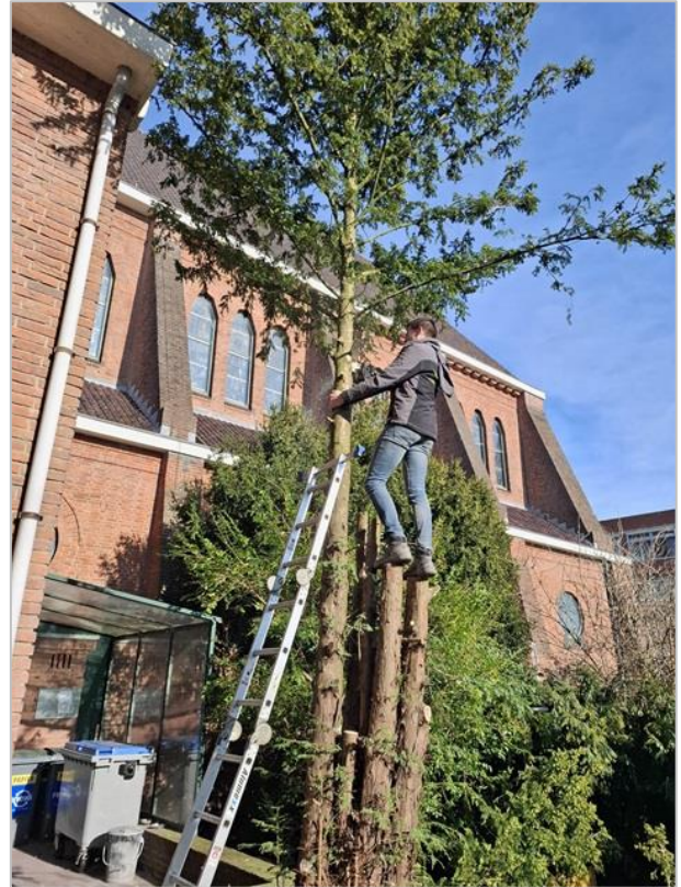
Het kappen van de boom