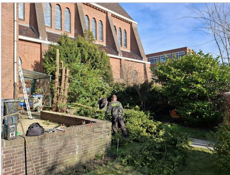
De bladerkronen zijn eraf

Een van de voorwaarden in de door de gemeente afgegeven kapvergunning betreft de herplantplicht. De gedachten gaan uit naar een fruitboom die volgens de gemeentelijke bepalingen overal in de tuin van de Abt geplant mag worden.