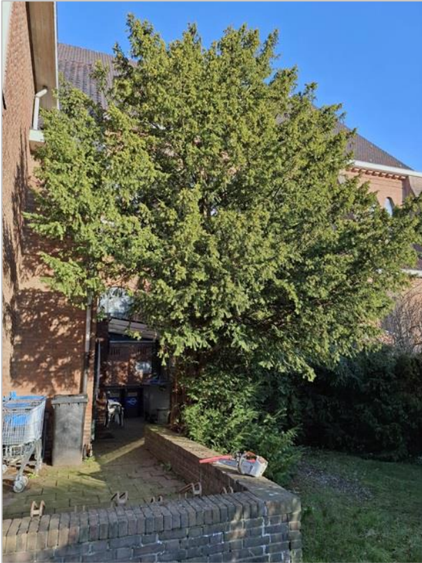
De oude situatie

Na jaren intern overleg is het er dan toch van gekomen... de boom waarvan de wortels onder meer de riolering van het toilet bij de pastoriekeuken beschadigd hebben, is op woensdag 5 maart gekapt en de boomstronk uitgegraven. Er zitten nog wel hier en daar kleine wortels in de grond onder het bordes maar die groeien nu niet meer verder.