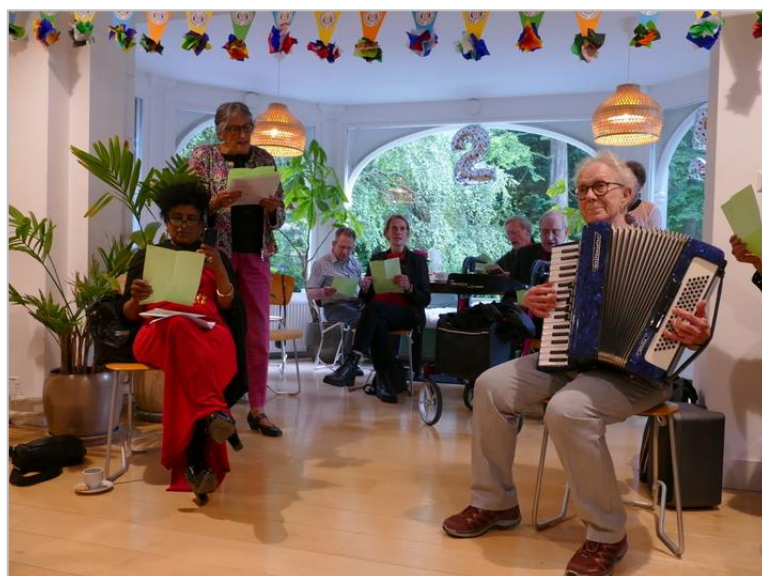
Feest in het Elisabeth Vredehuis