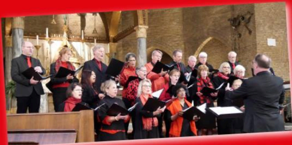
Koor Laus Deo