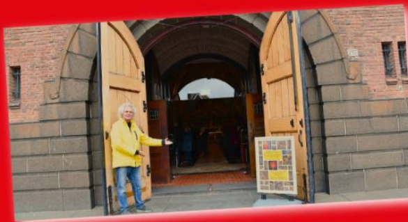
Antonius Abt kerk