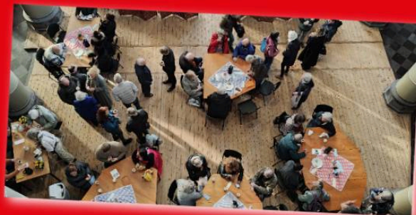
Ontmoeting na de viering