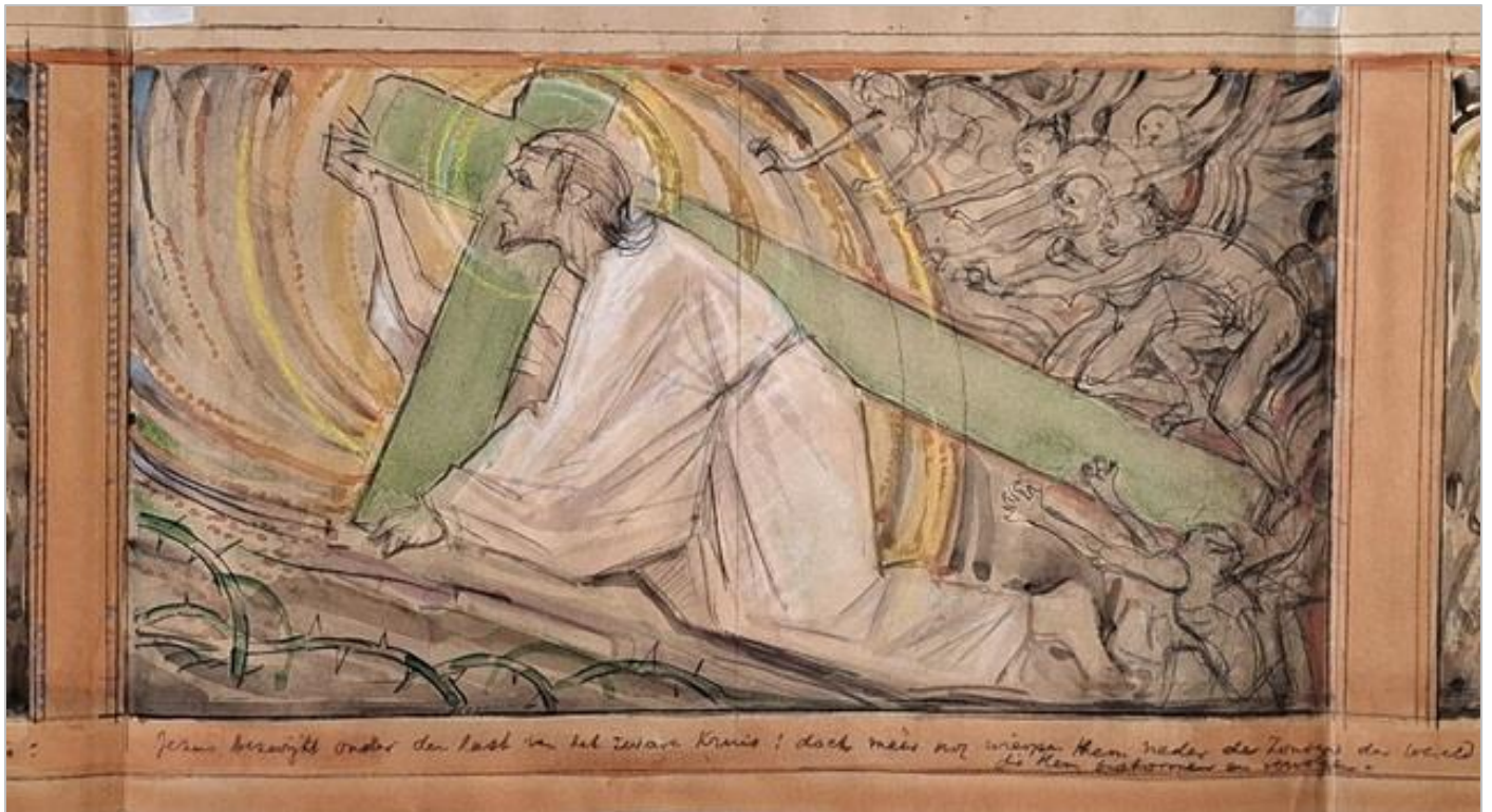
Het middendeel van de ontwerptekening

door de last van de zonden der wereld: 'Jezus bezwijkt onder den last van het zware Kruis: doch meer nog wierpen hem neder de Zonden der Wereld die hem bestormen en vervolgen'.